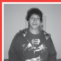
1. Preis: Digitalkamera Ricardo Dufner